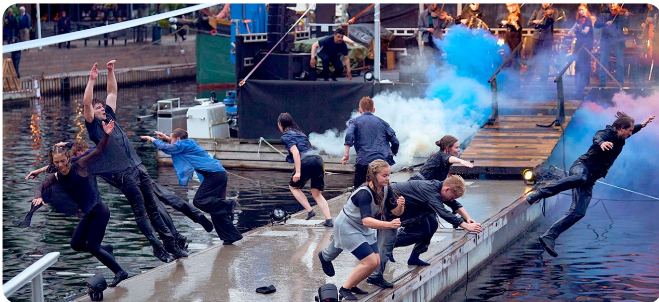
Festivaalin avajaisseremonian lopuksi tanssijat hyppäävät laiturilta veteen.

Kirjoittajat Josefiina Mustonen ja Marta Tapio, Tahdittomat ry