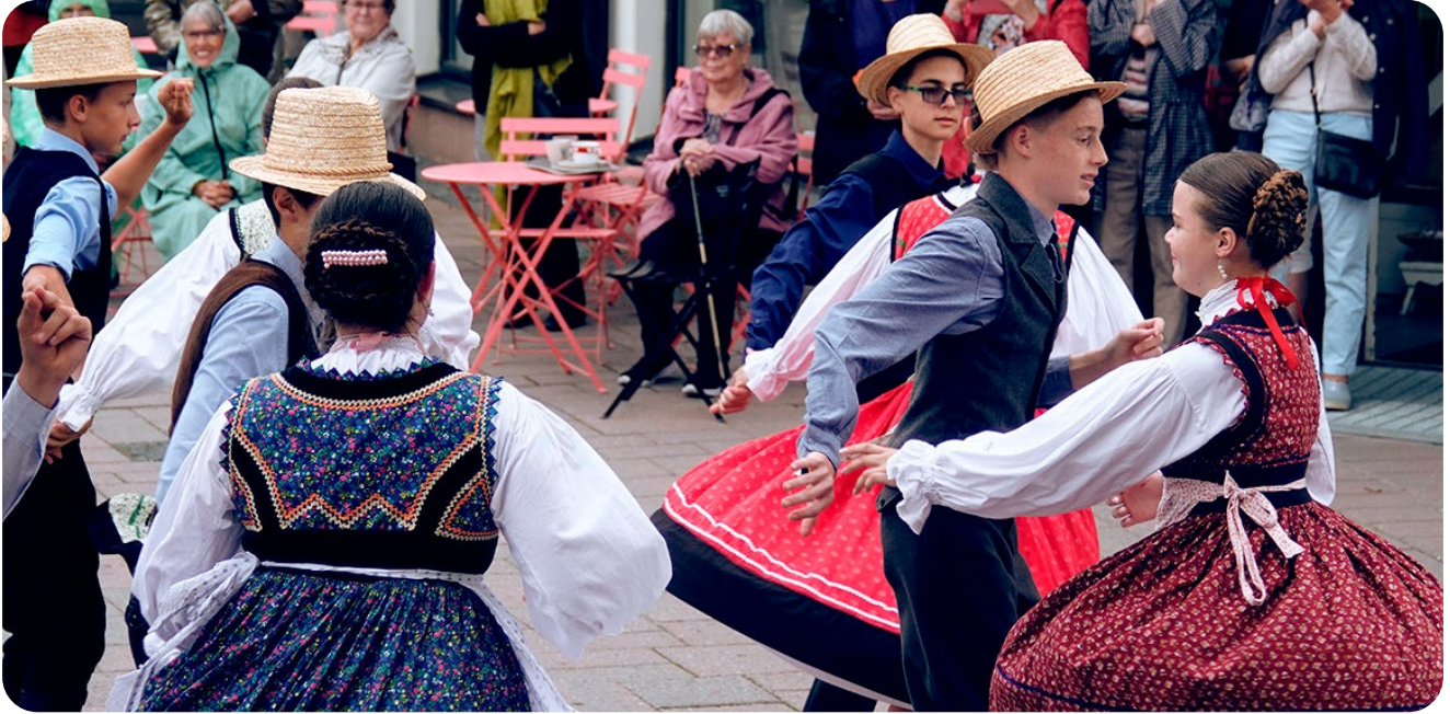
▲ Unkarilainen Szilágyi Táncegyüttes -ryhmä tanssimassa Ragnar Granitin aukiolla.

Suhina ja oman seuran aikuisryhmät. Ilta päättyi Rixu-Dixin musisointiin.