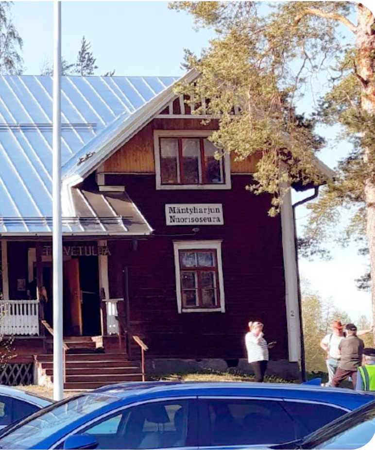
◀ Uusi katto valmistui huhtikuun lopussa. Kuva talon pihalta ennen Mäntyharjuseuran Vuosirenkaita – teoksen ensi-iltaa 16.5.2024.