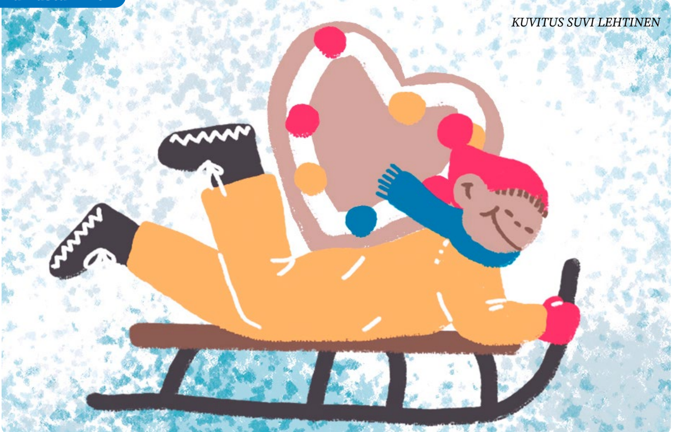
KUVITUS SUVI LEHTINEN