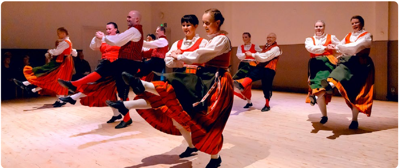
▲ Tikki-klassikot kuuluivat myös konsertin ohjelmistoon. Polkan rytmettä koettiin monen kappaleen verran.

lut kuudella eri vuosikymmenellä syntyneet tanssijat, mitä arvostetaan, sillä se tuo yhteiseen tekemiseen syvyyttä ja näkökulmia.