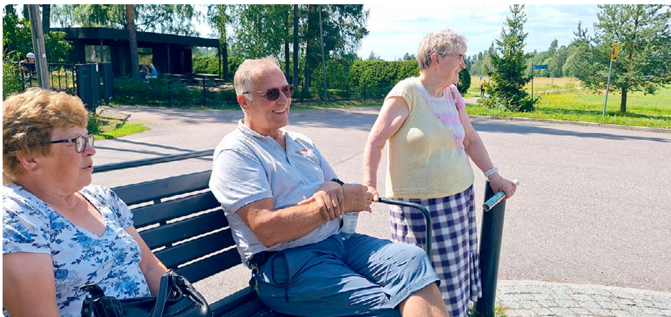
▼ Jean Sibeliuksen perheen koti Ainolassa.

Antoisa päivä päätettiin Pytingin Puotiin ja Vanhan- kylän kartanokahvilaan. Upea 1800-luvulla rakennet- tu kartano on remontoitu vanhaan asuunsa. Pihapii- rissä sijaitsevassa kulttuurihistoriallisesti arvokkaas- sa Yläpytingissä on kädentaitomyymälä Pytingin Puo- ti, jossa on käsityöläisten valmistamia uniikkeja tuot- teita myynnissä.